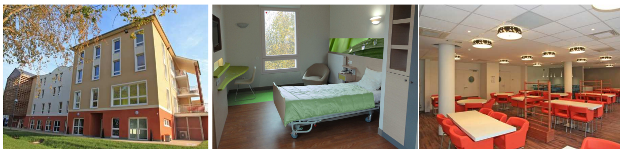
Korian La Mare O Dans

Avec 9 établissements, dont 8 maisons de retraite médicalisées (EHPAD) et 1 clinique psychiatrique, Korian est largement implanté dans la région Haute-Normandie.